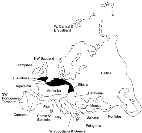
Рис. 2. Назви терейнів і їхні границі на карті Європи (А. Г. Сміт, 1993)

Сьогодні загально визнаним є твердження європейських тектоністів (Ф. Данінг, Р. Раст, Г. Гертнер, Г.-Ю. Пейх, П. Банквіцт та ін.) про те, що ні в байкальську, ні в каледонську епохи в межах цієї області варисцид жодні тектонічні структури не сформувалися. Не виділяється вже зона епікаледонської консолідації в межах Брабантського масиву, де сейсмічними дослідженнями ECORS і COCORP встановлено насув на нього варисцид, а не каледонід. Цими ж дослідженнями у верхніх шарах земної кори виділено насуви і шар'яжі. Останні знизу обмежені субгоризонтальними площинами тектонічних зривів, нижче від яких породи залягають горизонтально. А це свідчить проти моделей тектогенезу регіону, які відводили головну роль вертикальним, блоковим рухам по розломах [Проблеми..., 1983]. Таким чином, у межах Західної і Центральної Європи немає тих ознак, які б давали підставу трактувати цю ділянку земної кори як "молоду платформу". І водночас, зважаючи на правило пріоритету, необхідно залишити назву, яка використовується європейськими геологами – варисциди (або герциніди) Західної і Центральної Європи.