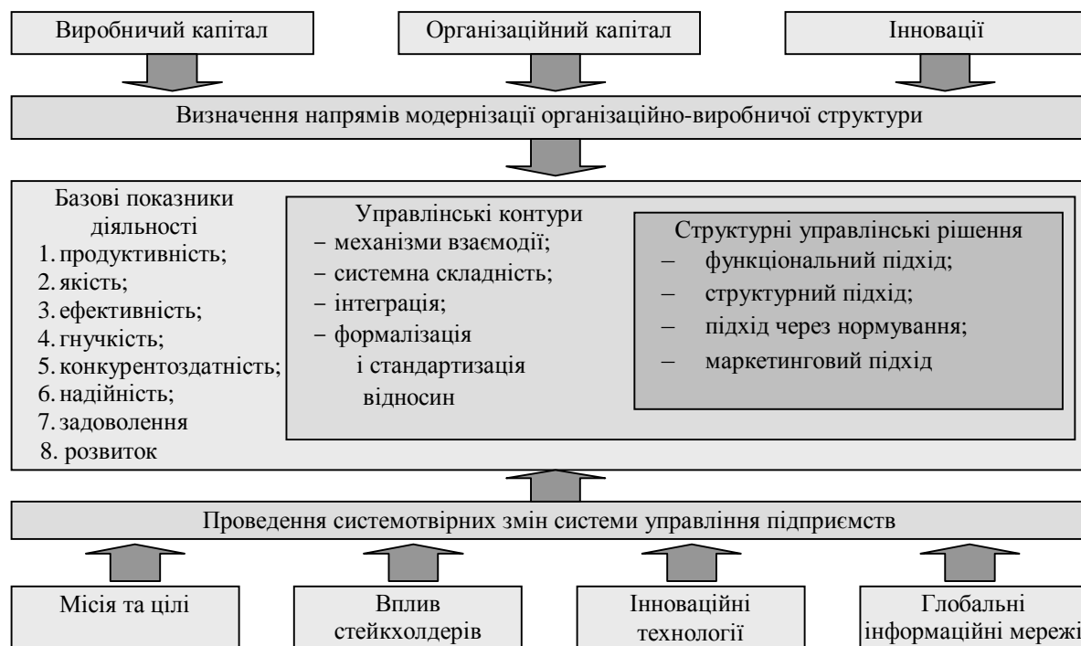
Рис. 3. Концептуальна схема модернізації організаційно-виробничої структури

організаційного капіталу цих підприємств зумовлена необхідністю підтримання конкурентоспроможності в рамках організаційно-виробничої структури. Узагальнену схему модернізації підприємств наведено на рис. 3.