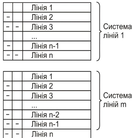
Рис. 3. Системи ліній у складі ресурсу

Для взаємодії користувачів із системою (підсистема штучного інтелекту в цьому випадку також розглядається як особливий вид користувача) застосуємо поняття інтерфейсного ресурсу . Такий ресурс має додаткову числову характеристику, крім кількості – активованість . Найменше значення, значення за замовчуванням для активованості – 0, найбільше – кількість інтерфейсного ресурсу. Активованість задається користувачем, і при обчисленні споживання і виробництва ресурсів використовується замість кількості для цього ресурсу. Взаємодія користувачів між собою відбувається лише у межах площадок взаємодії. Основна їх відмінність від елементарних ігор для одного гравця – область, що доступна для обчислення під час оброблення ресурсів. Ресурс, що належить до елементарної гри для одного гравця, може враховувати, використовувати і виробляти ресурси із будь-якої елементарної гри, проте ці ресурси належать лише поточному гравцеві. Ресурс із площадки взаємодії, крім цього, може ще враховувати, використовувати і виробляти ресурси, що належать іншим гравцям, проте лише у межах поточної елементарної гри.