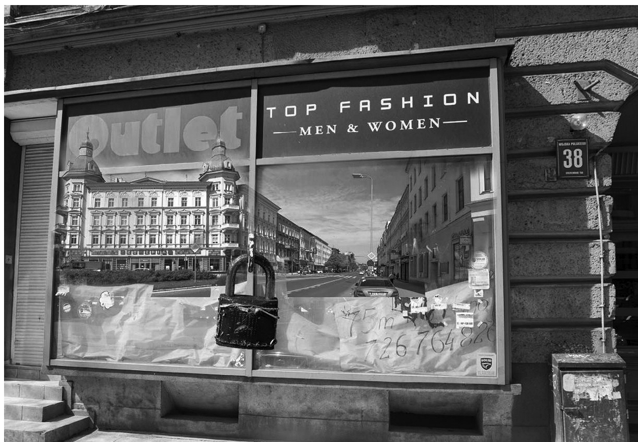
Fig. 11. Photomontage dedicated to dying of the Wojska Polskiego Avenue.

But is it really possible? Can we repair the damage done not only to Wojska Polskiego Avenue but also the whole neighbourhood shopping area in Szczecin that was destroyed by the unfavourable location of big shopping centres in the very heart of the city?