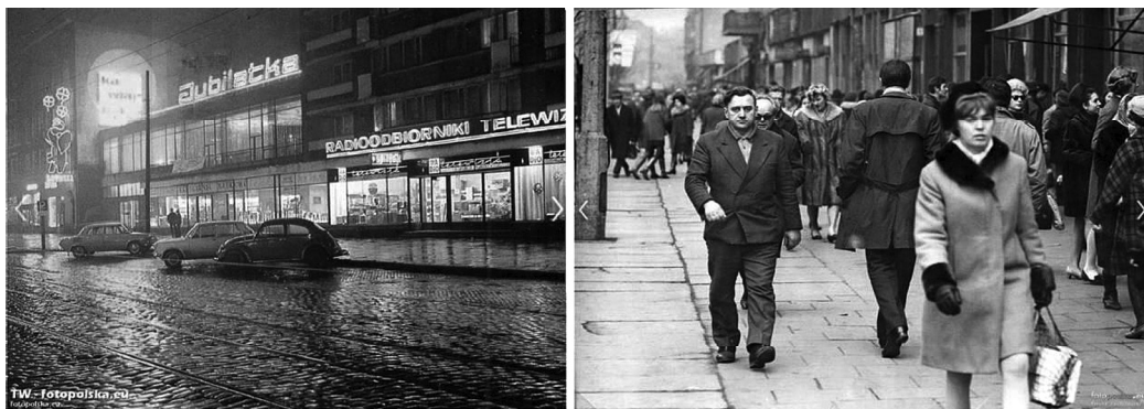
Fig. 4. View of Wojska Polskiego Avenue, 1965–70.