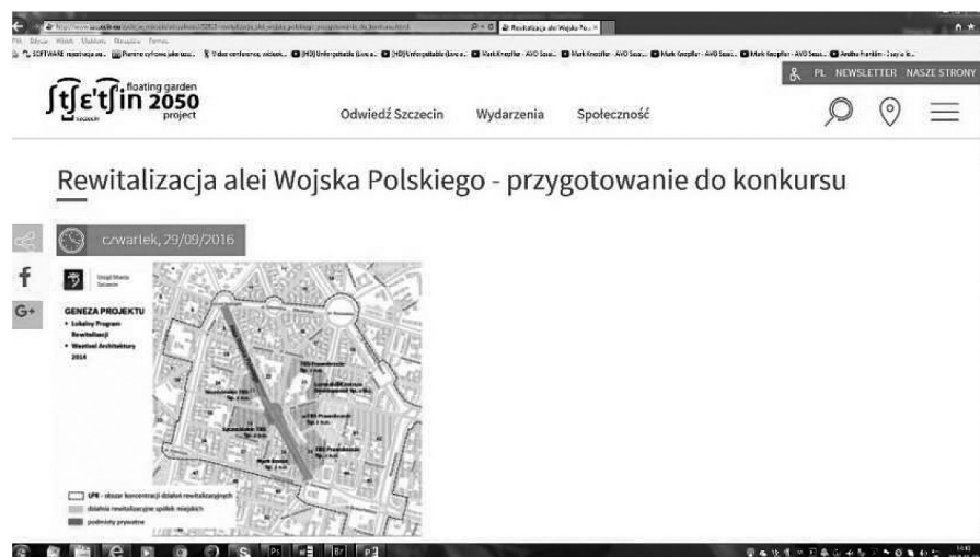
Fig. 10. City website containing the information about tender on revitalization of Wojska Polskiego Avenue.

It is not surprising that most of the citizens of Szczecin chooses the shopping centers, especially when the weather is bad. The city administration has finally noticed the issue. There is an idea to restore, at least partially, the greatness of the Avenue. The preparations for tender on revitalization of the Wojska Polskiego Avenue has already been launched (Fig. 10, 11).