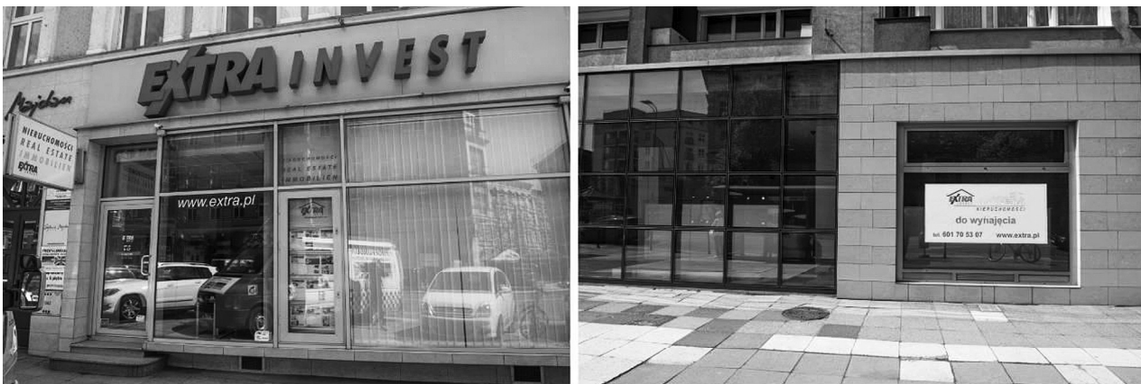
Fig. 8. Left: Real estate office on Wojska Polskiego Avenue providing rental and sale services. Right: One of numerous business in the real estate company's offer.

The demand for rental and selling of the businesses was so great that one of the real estate companies opened their office there to provide the services (Fig. 8).