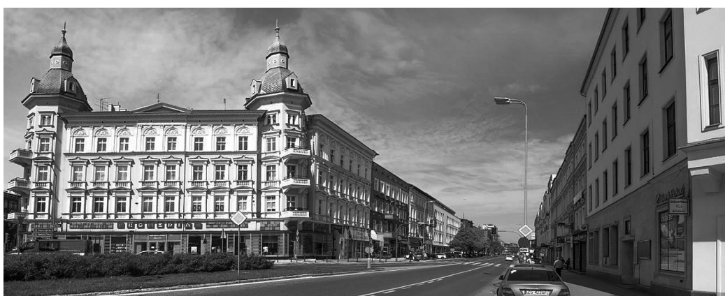
Fig. 5. View on Wojska Polskiego Avenue from Zwycięstwa Square, 2017. Source: photo by Waldemar Marzęcki

http://www.szczecin.fotopolska.euSzczecin115240,al_Wojska_Polskiego.htmlf=95321-foto1969