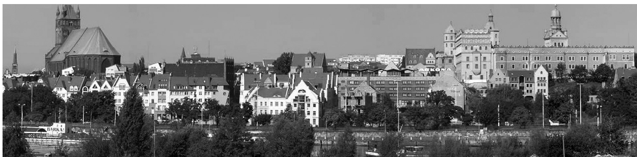
Fig. 3. Panoramic view on developing borough in Szczecin.

The area of the Old Town is mostly filled with modern buildings inspired by historical developments. As opposed to previously mentioned developments in the upper part of the Old Town, the lower part is mostly developed in a close compliance to the former old-town arrangement. A part of the Old Town was however set for infrastructure investments. Most of the free spaces of the Old Town and Rynek Sienny (Haymarket) are nowadays developed. The residents of Szczecin are more and more aware of this place. For almost 49 years Szczecin was deprived of its historical heart. This influenced the behavior and perception of the citizens. The lack of the Old Town resulted in a creation of a different center located along the Wojska Polskiego Avenue. The part of the longest street in Szczecin, between the Szarych Szeregów Square and Zwycięstwa Square, started to be the meeting place thanks to existence of the exclusive boutiques, restaurants and coffee shops. Taking a walk on Wojska Polskiego Avenue was viewed as a good taste (Fig. 4, 5).