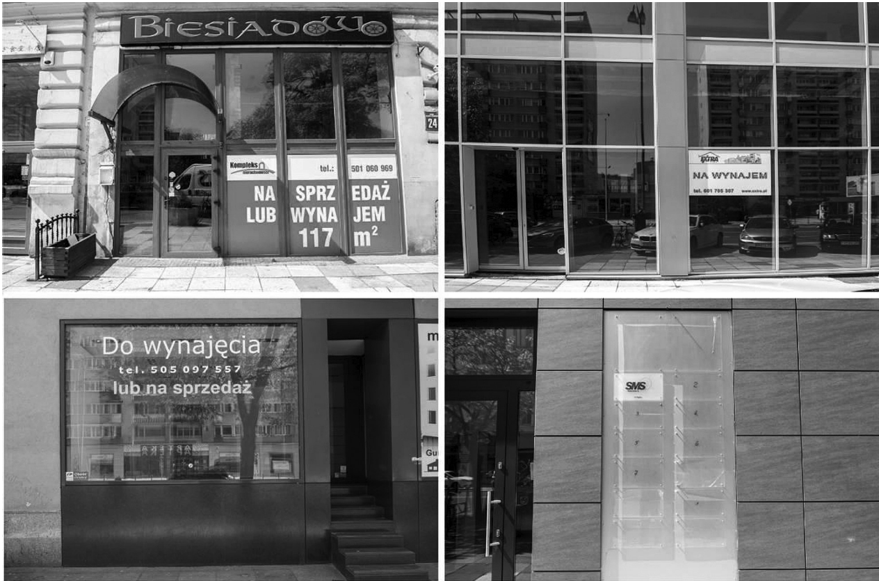
Fig. 7. Examples of business premises for sale or rent.

The demand for rental and selling of the businesses was so great that one of the real estate companies opened their office there to provide the services (Fig. 8).