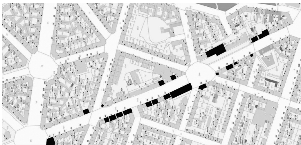
Fig. 6. Wojska Polskiego Avenue. Black spots mark shops for rent or sale.

After the political transformation in 1990, Poland started to undergo dynamic changes. The shops on Wojska Polskiego Avenue were overflowed with western merchandise. On a long run however, the political transformation meant a death to the shops. Suddenly the Wojska Polskiego Avenue started to die slowly. One shop after another was being closed. Only “For Rent” and “For Sale” signs decorated the windows of the shops. The approximate number of closed shops on the Wojska Polskiego Avenue was made (as of 20.06.2017) and is presented on the photos below (Fig. 6, 7):