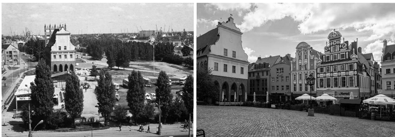
Fig. 2. Left: Development condition of the Castle borough in the '80s. Right: Rynek Sienny (Haymarket), 2017.

The issue of bombardment of the Old Town is especially important for the topic of this paper. After the War, the Old Town buildings were not reconstructed. The renovations included only a small number of surviving historical constructions, and among them the Pomeranian Dukes' Castle had a top priority. Consecutively, renaissance Loitz House and Old City Hall were renovated. The rest of the Old Town was only cleaned from the rubble and left for decades without any intervention. The upper part of the Old Town started being developed in the 1960s. The apartment housing complex was build up there. Fortunately, due to financial problems the plans for constructing four high rise buildings in the close neighborhood of the Old City Hall were dropped. Only in 1994 the development of the lower parts of the Old Town, considered as a Castle borough, started to unfold. The implementation of this construction project agreed with the compliance to historical spatial arrangement of this part of the city (Fig. 2, 3).