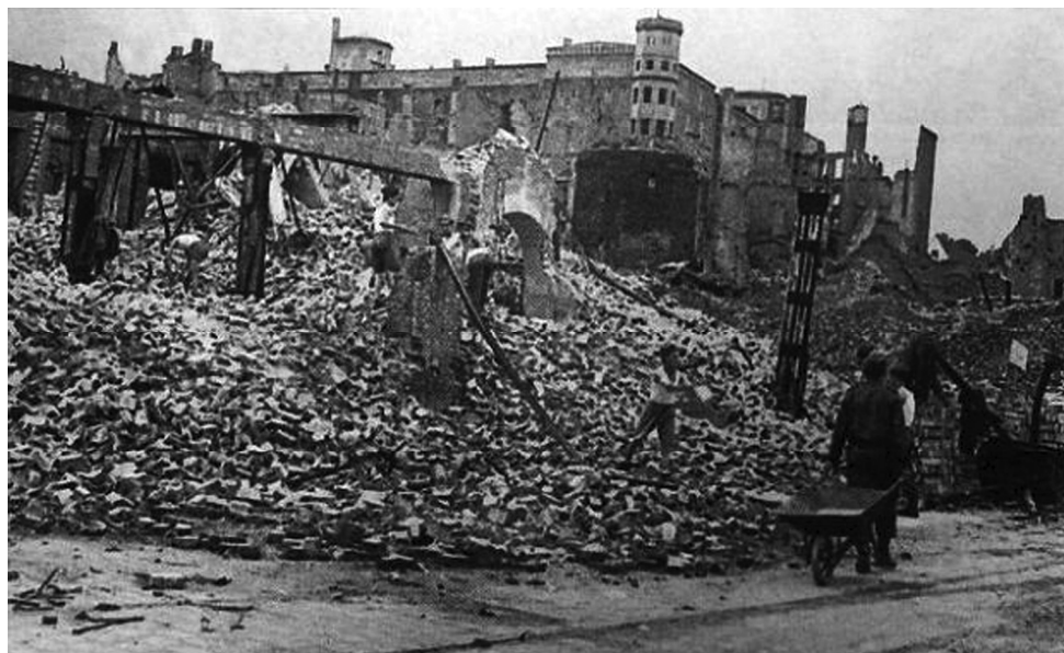
Fig. 1. A view on a bombed Castle borough. In the back Pomeranian Dukes' Castle in Szczecin.

Szczecin during the Second World War was a target of intense Allies bombardments. As an important industrial center, especially considering the existing harbour, it was particularly exposed to attacks. As a result, majority of the city infrastructure was destroyed, including almost 90 % of the Old Town (Fig. 1).