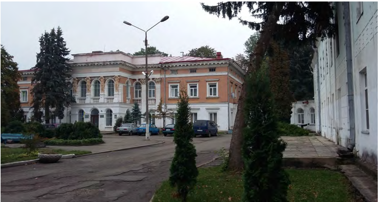
Рис. 2. Вигляд на головний фасад колишнього палацового комплексу XVIII ст. у Микулинцях, 2015 р.

Значна частина цього палацового комплексу збережена до сьогодні (рис. 2, 3). Палац стоїть у центрі парку. Його парковий фасад прикрашений восьмипілястровим портиком коринфського ордера. Звідси ландшафтний парк спускається крутими схилами до ріки, а ліворуч до нього прилягають руїни замку. У парку збереглися три двохсотлітні ясени. Палац і старі флігелі утворюють широкий двір-курдонер. Від головного фасаду кленова алея веде до Троїцького Костелу. Посеред алеї є колодязь, оточений п'ятьма віковичними кленами. Колись палац мав розкішні парадні зали з ампірними розписами на стелі. Сьогодні розписи є втрачені. Стіни приміщень колишнього палацу поштукатурені та пофарбовані.