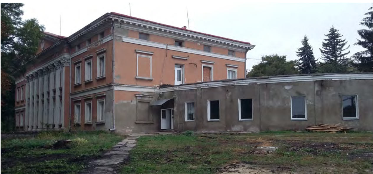
Рис. 3. Вигляд на парковий фасад колишнього палацового комплексу XVIII ст. у Микулинцях, 2015 р.