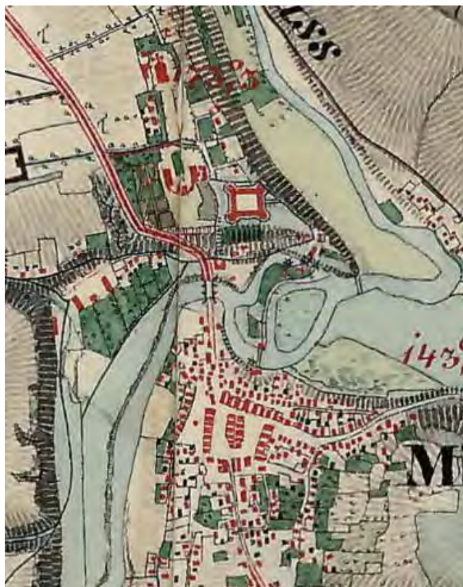
Рис. 1. Микулинці. Історична карта періоду імперії Габсбургів (1806–1869 рр.) Фрагмент [3].

Від Конєцпольських Микулинці перейшли до Синявських, від них до Любомирських. У другій половині XVIII ст. микулинецький ключ купила Людвіга з Мнішів Потоцька вдова Йозефа краківського каштеляна, великого коронного гетьмана. В той час замок існував у повному обсязі, але не був сучасною садибою. Була це масштабна двоповерхова споруда, збудована з коленого каменю на плані квадрата, кожна сторона якого мала довжину 75 метрів. По трьох кутах замку виступали потужні циліндричні башти [5]. Об'ємно-просторова композиція споруди мала яскраво виражений оборонний характер, що не відповідало новітнім поглядам того часу. Тому неподалік від середмістя у 1760-ті роки Людвіга Потоцька заклала чудовий палац з парком, який мав традиційне