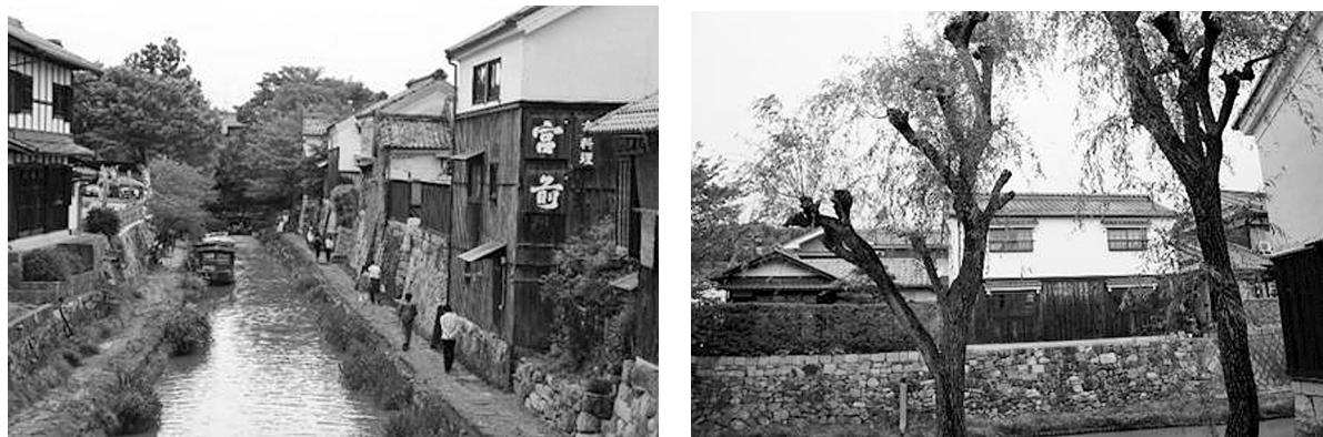
Рис. 7. Омі Хачіман та канал Хачіман-борі