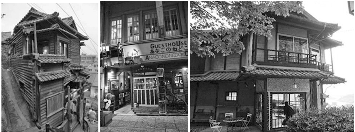
Рис. 6. Відроджені будинки проекту Акія Сайсей : Ономічі Гауді , Анаго-но-Недоко , Міхараші-тей