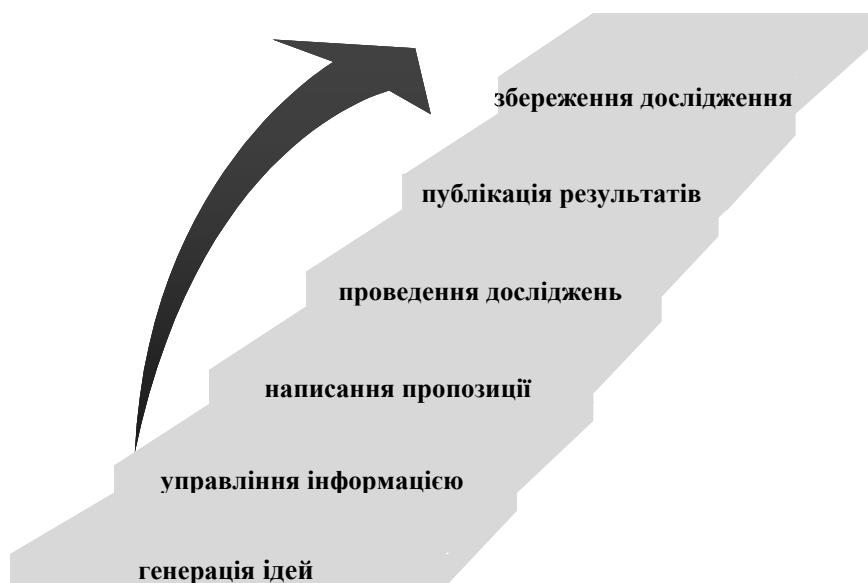
Рис. 1. Етапи циклу досліджень