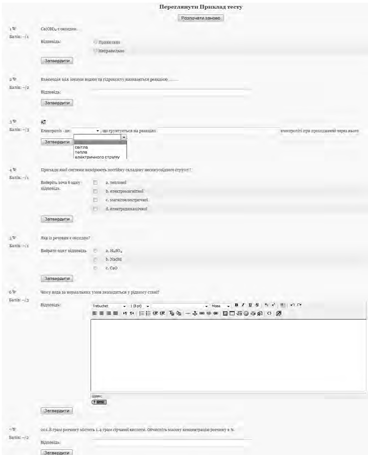
Рис. 2. Приклад тестового “білету” у ВНС ЛП

Згідно з “Рекомендаціями до формування завдань для контрольних заходів та екзаменаційного контролю” (Додаток 4 “Тимчасового положення про оцінювання знань та визначення рейтингу студентів у кредитно-модульній системі організації навчального процесу”) [5] до питань першого рівня складності можуть належати завдання на розпізнавання, розрізнення, класифікацію об’єктів, явищ і понять; до питань другого рівня – тести-постановки, конструктивні тести та типові задачі; до питань третього рівня складності належать нетипові задачі на застосування знань у реальній практичній діяльності.