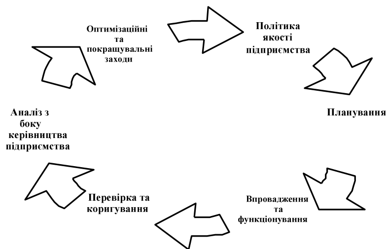
Рис. 2. Модель системи менеджменту економіко-експертної служби підприємства

Дійте: постійне поліпшення показників діяльності підприємства за рахунок якості управлінських рішень на основі отриманих висновків експертних досліджень.