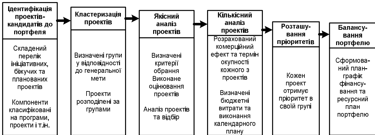
Рис. 2. Узагальнений алгоритм процесу формування портфеля проектів

Процес формування портфеля можна подати у вигляді ітерацій (рис. 2), кожна з яких передбачає такі кроки.