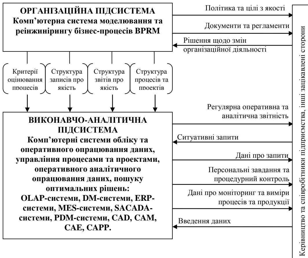
Рис. 3. Структура комп'ютеризованої СУЯ та її інформаційне забезпечення.

На рис. 3 показано структуру комп'ютеризованої СУЯ та механізми її інформаційного забезпечення засобами CALS-технологій.