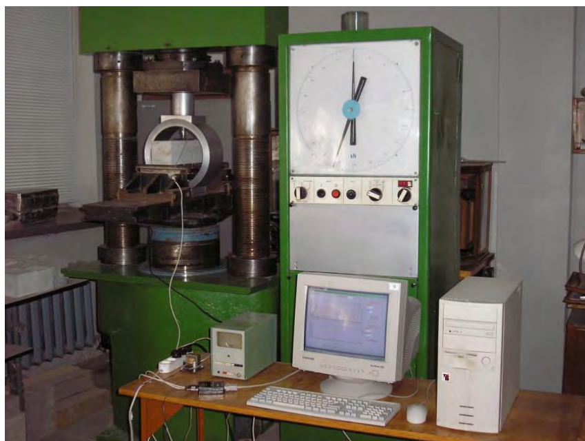
Рис. 1. Загальний вигляд випробувальної установки

Номінальний склад бетонної суміші базової серії: Ц : П : Щ = 1:2,23:3,19 при В/Ц=0,44 і витраті цементу 350 кг/м 3 . Склад суміші заповнювачів проектували згідно з європейським стандартом EN 480-1 з неперервною гранулометриєю. Всього виготовлено чотири серії зразків, кожна з яких складається з чотирьох призм розмірами 0,10×0,10×0,40 м та трьох кубів розмірами 0,10×0,10×0,10м.