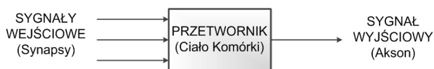
Rys. 1 Cybernetyczny model neuronu

Z cybernetycznego punktu widzenia neuron biologiczny można traktować jako specyficzny przetwornik sygnałów. Jest to układ o wielu wejściach i jednym wyjściu jak jest to przedstawione na rysunku 1 (Rys. 1) 17 .