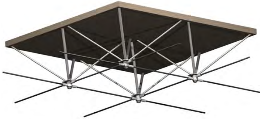
Рис. 1. Фрагмент структурно-вантового сталезалізобетонного покриття

Структурно-вантова сталезалізобетонна конструкція об'єднує матеріали, що працюють на властиві для себе зусилля. Таке покриття складається із верхнього й нижнього поясу та структурної решітки (рис. 1).