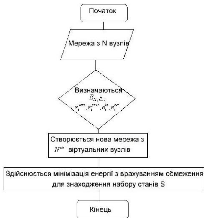
Рис. 1. Блок-схема пропонованого алгоритму

Запропонований алгоритм повинен знати точну топологію мережі, тобто як вузли з'єднані один з одним (матриця E_x ) і яка відстань між будь-якими двома з них (матриця \Delta ). Для обчислення загальної функції вартості потрібна додаткова інформація, така як параметри для моделювання радіоканалу, передавання, приймання, зчитування і оброблення споживання енергії кожного вузла, залишкова енергія кожного вузла, робоча частота і швидкість передавання даних.