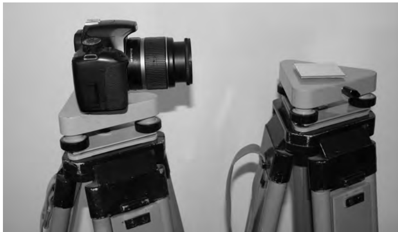
Рис. 2. Загальний вигляд розташування приладів при визначенні фокусної віддалі

Розглянемо технологію визначення фокусної віддалі. Встановлюють два штативи у безпосередній близькості один від одного. За допомогою накладного рівня горизонтують підставки. На одну з них встановлюють цифрову камеру з допомогою втулки, а на другу (у горизонтальному стані) – фрагмент контрольно-вимірної сітки (рис. 2).