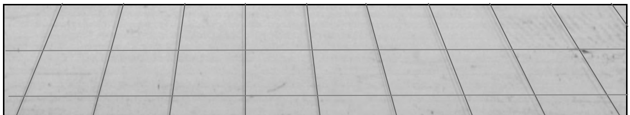
Рис. 3. Фрагмент зображення контрольно-вимірної сітки

Орієнтують цифрову камеру відносно контрольно-вимірної сітки так, щоб мітки фокатора проходили через центральну вертикальну риску контрольно-вимірної сітки, після чого виконують знімання сітки. Надалі на цифровій фотограмметричній станції (ЦФС «Дельта-2») у вікні «Взаємне орієнтування» проводять виміри відповідних координат сторін, які фігурують у формулі (3) та обчислюють фокусну віддаль (рис. 3).