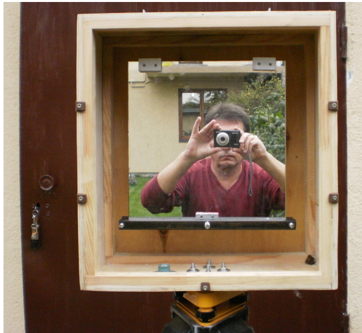
Рис. 3. Лабораторний взірець дзеркального відбивача з прямовисно встановленою відбиваючою поверхнею

центра ваги. Юстування дзеркального відбивача з встановлення відбиваючої площини у прямовисне положення виконувалось за допомогою теодоліта Theo 010В шляхом вимірювання зенітних віддалей на центр об'єктива та зміщенням центра ваги тягарця. Прямовисне положення відбиваючої поверхні відповідає виміряній зенітній віддалі 90^{\circ} 00' 00'' на центр зображення об'єктива теодоліта у дзеркалі.