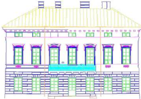
Rys. 5 Zwektoryzowana elewacja ogrodowa Pałacu Lubomirskich

Po wektoryzacji wszystkich stereogramów, otrzymano trzy osobne mapy elewacji, które następnie połączono w jedną całość (rys. 5) w module Mapping.