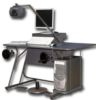
Rys. 1 Stacja cyfrowa Delta firmy GeoSystem

Stacja ta posiada stały znaczek pomiarowy oraz możliwość przewijania obrazów z wykorzystaniem menu nawigacyjnego scrollable, co zwiększa jej funkcjonalność, gdyż nie wymaga myszy 3D. Użytkownik może przemieszczać znaczek pomiarowy klasyczną korbą (układem tarcz nożnych) lub zwykłą myszką. Do obserwacji wykorzystuje się okulary polaryzacyjne lub stereoskop (rys. 1).