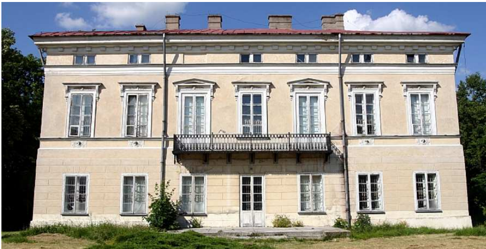
Rys. 2 Elewacja ogrodowa Pałacu Lubomirskich