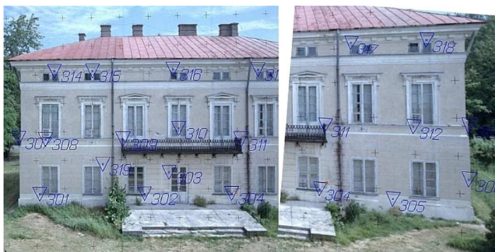
Rys. 4 Schemat rozmieszczenia fotopunktów na elewacji budynku

Orientacja absolutna opierała się na 19 fotopunktach, które zostały wybrane w miejscach charakterystycznych, łatwych do identyfikacji. Pomiarów geodezyjnych dokonano przy pomocy dalmierza laserowego, dlatego fotopunkty założone zostały w miejscach stosunkowo płaskich, aby odczyt był jednoznaczny. Najczęściej były to plamki na murze lub ostre krawędzie. Rozmieszczenie fotopunktów na elewacji przedstawia rysunek 4.