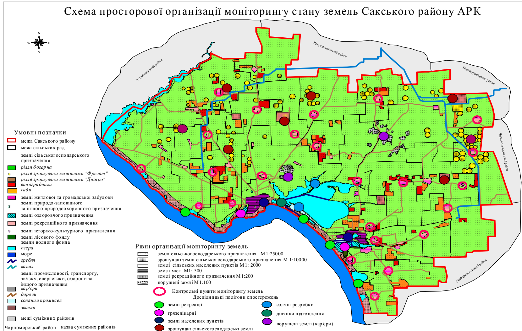
Рис.2. Схема просторової організації моніторингу стану земель Сакського району