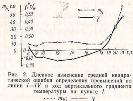
Рис. 2. Дневное изменение средней квадратической ошибки определения превышений по линии I—IV и ход вертикального градиента температуры на пункте I.

Для всего периода наблюдений наименьшие m_h соответствуют сравнительно коротким (3—4 км) линиям с достаточно большими эквивалентными высотами (линии I—IV, II—VII). Наиболее низ-