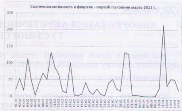
Рис. 4. Изменения солнечной активности во время землетрясений в Японии

Key words: earthquake prediction; dependence; solar activity.