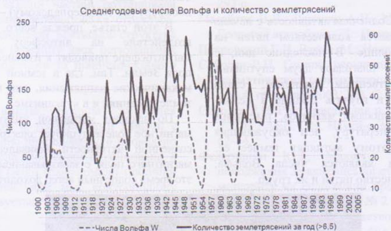
Рис. 2. Среднегодовые числа Вольфа и количество землетрясений

Конечно, не события на Солнце вызывают активные процессы в литосфере и человеческом сообществе. Но общей «спусковой» причиной для явлений в социуме и литосфере являются быстрые процессы в фотосфере и глубинных слоях нашего Светила. А они, в свою очередь, стимулируются и изменениями расположения тел солнечной системы, прежде всего планет-гигантов Юпитера и Сатурна.