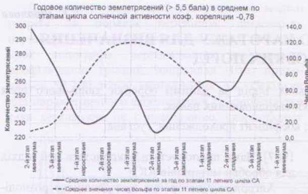
Рис. 3. Анализ методом наложения эпох

5 дней уровень СА вырос с 40 до 100, в два с половиной раза. В следующую неделю рост СА продолжался.