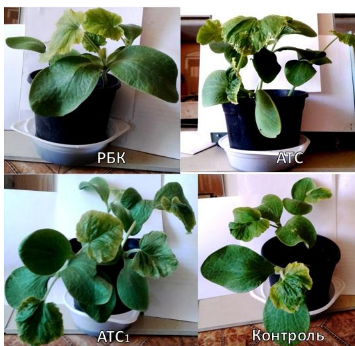
Рис. 3. Вплив АТС, РБК та композиції АТС 1 на ріст гарбуза звичайного