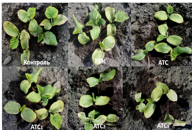
Рис. 1. Вплив РБК, АТС та їх композицій на ріст гарбуза звичайного

Виклад основного матеріалу і обговорення результатів. На першому етапі дослідження проаналізовано вплив композиції на основі АТС та РБК за різних співвідношень на схожість насіння гарбуза звичайного за росту на відкритому ґрунті. Порівнюючи дослідні варіанти, спостерігали стимулювальний ефект як за дії РБК, так і за дії АТС, проте кращі результати були зафіксовані за комплексної дії розробленої композиції АТС 1 щодо контролю, що показано на рис. 1, 2.