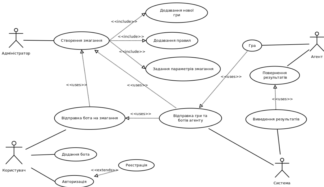
Рис. 1. Діаграма варіантів використання системи

Діаграма варіантів використання (use case diagram) дає найзагальніше уявлення щодо функціонального призначення системи (рис. 1). Діаграми діяльності (activity) є засобом опису поведінки у формі графу діяльності (рис. 2, а).