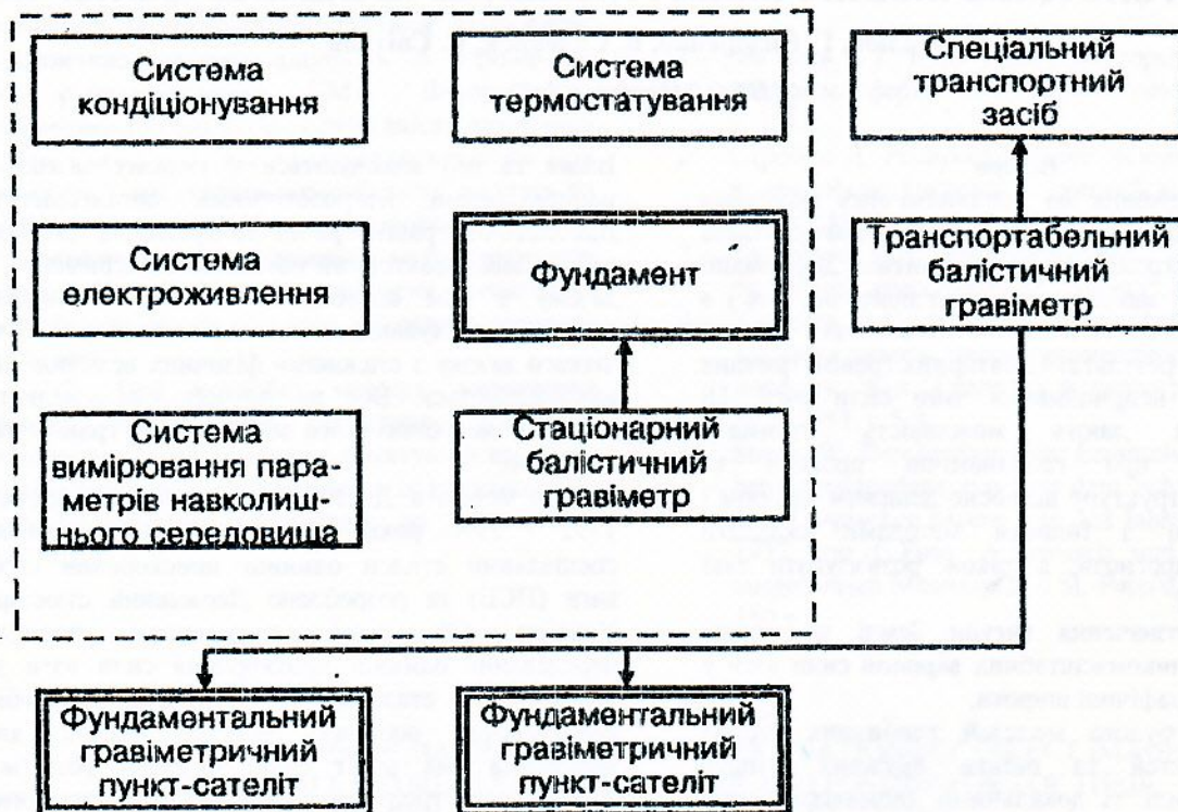
Рис. 1. Структура еталона одиниці прискорення сили ваги.

для високоточних гравіметричних спостережень і розташовані на відносно невеликій відстані від еталонного фундаментального пункту (селище Липці Харківської області та Полтавська гравіметрична обсерваторія).