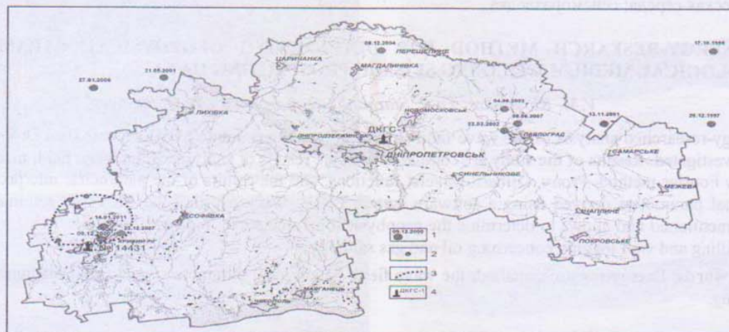
Рис. 1. Обзорная карта эпицентров землетрясений и скважин мониторинговых наблюдений за параметрами подземных вод:

Криворожско-Кременчугская техногенная зона. На протяжении последних 30-и лет идет процесс интенсивных и высокотехнологичных горнодобывающих работ в Криворожском и Кременчугском железорудных бассейнах. Огромные объемы горных пород в одних местах (карьеры, шахты) «изымаются» в других накапливаются (хвостохранилища, шламо-накопители и т.д.). Происходит перераспределение масс, что в значительной мере изменяет локальные поля тектонических напряжений. Разрушение пород может при этом происходить как в виде быстрых движений – землетрясений, так и в виде криповых явлений. Неожиданный процесс высвобождения внутри-коровых, а, возможно, и мантийных нагрузок в районе Кривбасса может приводить к проявлению техногенно спровоцированных землетрясений.