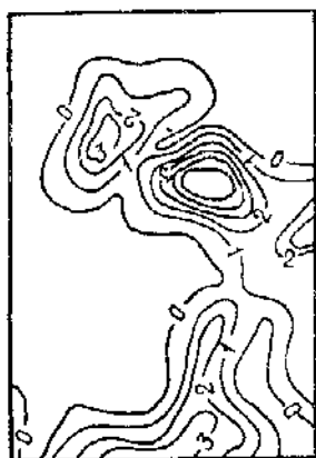
Рис. 2. Фрагмент тематической карты поля плотности размещения источников выбросов:

1 — объем выбросов; 2 — границы районов города; 3 — акватории.