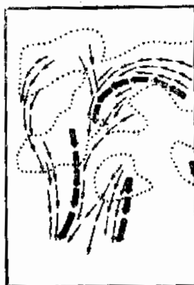
1 2 3 4