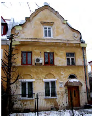
Рис. 1. Будинок за адресою вул. Офіцерська (О. Пчілки) 25, арх. Тадей Врубель. [Джерело: фото Е. Я. Садовської]

особливо цікаві частини фасадів були добре видимі. Архітектурний ритм будівлі мусить знайти відповідний акомпанемент у розміщенні темних плям корон дерев” [45]. Вулиця Черешнева, обсаджена по обидва боки рядами квітучих дерев, зафіксована на архівних зйомках у збірці Польського національного цифрового архіву [46], [47]. Коли міське управління планувало обсаджувати ближні вулиці дрібнолистовими ясенями, Правління поселення рішуче протівилося, оскільки розростаючись, вони б заслоняли старанно розроблені фасади будинків, що створюють гармонійну цілісність. Тому ті ж будинки були обгороджені однаковими низькими дерев’яними огорожами, а за ними закладено стрижені низькі живоплоти.