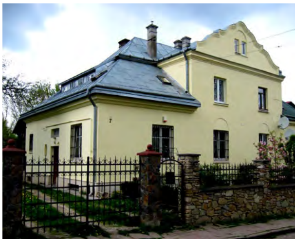
Рис. 2. Будинок за адресою вул. Черешнева, 7, арх. Вітольд Якімовські.