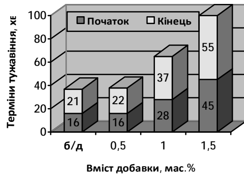
Рис. 1. Вплив добавки Sika Plast 520 на терміни тужавіння гіпсового тіста

Так, міцність ГЦПВ на основі неактивованих золи виносення та портландцементу становить 9,2 МПа, а на основі активованих – 12,2 МПа, тоді як міцність каменю на основі гіпсу становить 5,9 МПа. Коефіцієнт розм'якшення каменю на основі ГЦПВ з активованими золою виносення та портландцементом 0,72, тоді як на основі гіпсу – 0,38 ( \Delta K_p=89\% ).