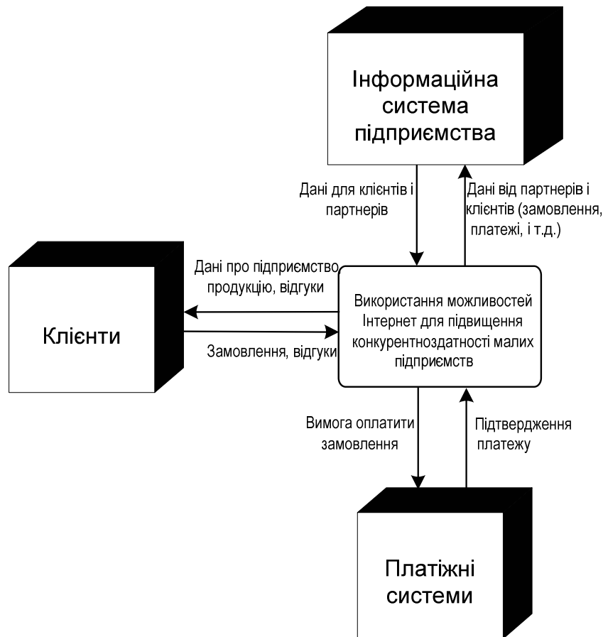
Рис. 1. Контекстна діаграма потоків даних системи

Розглянемо контекстну діаграму потоків даних розроблюваної системи.