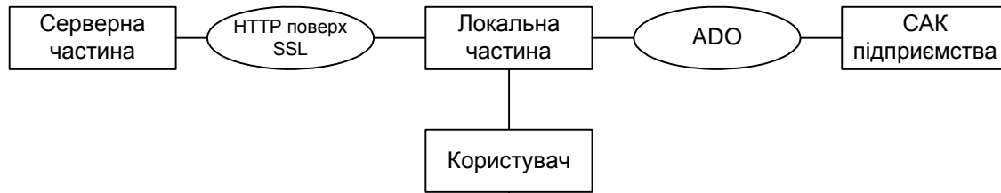
Рис. 4. Схема взаємодії локальної та серверної частин системи

Схематично взаємодію локальної частини інформаційної системи з серверною подано на рис. 4. Локальна частина інформаційної системи взаємодіє з САК за допомогою технології ADO, а з серверною частиною завдяки веб-службам (HTTP поверх SSL).