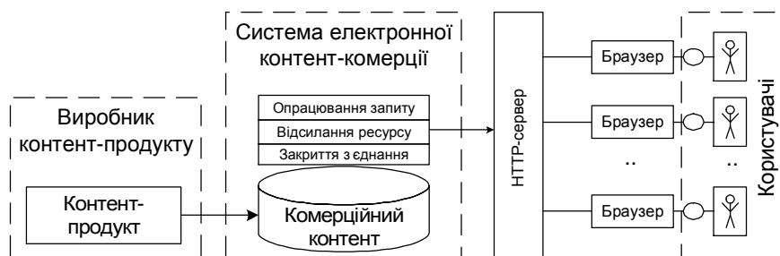
Рис. 1. Схема функціонування системи електронної контент-комерції

Загальну схему процесу функціонування системи електронної контент-комерції показано на рис. 1. Основними функціональними одиницями процесу є виробник контент-продукту, система комерційного поширення контенту, користувач системи (споживач-контент-продукту).