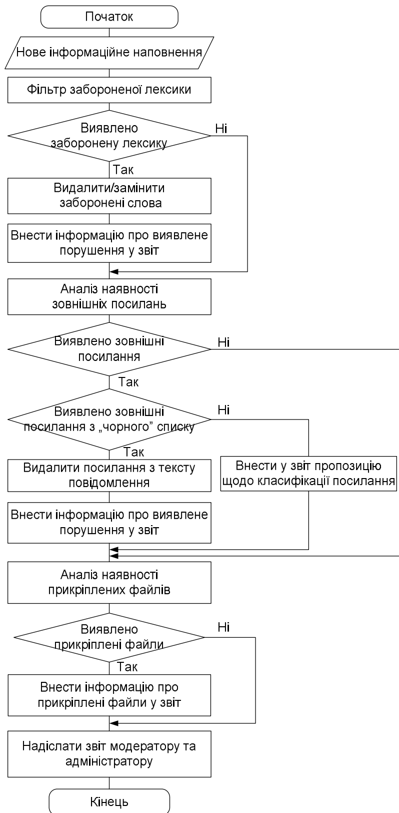
Рис.3. Алгоритм утиліти «Веб-цензор»

Цей алгоритм сприятиме зменшенню кількості конфліктів та скороченню часу на модерацию спільноти, і, завдяки цьому – зростанню контрольованості спільноти і підвищенню ефективності Веб-форуму [11]. Крім того, він дає змогу уникнути суб’єктивності адміністратора під час прийняття рішень, оскільки спирається на факти порушень та система правил комунікативної поведінки користувача Інтернет форуму.