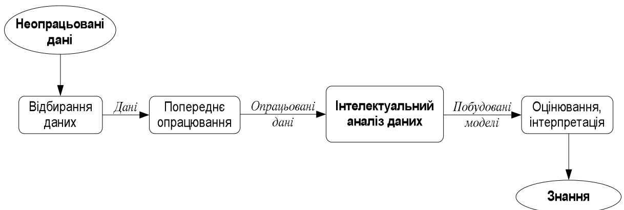
Рис. 1. Загальна схема процесу видобування знань

Послідовність етапів [1] видобування знань зображено на рис.1.