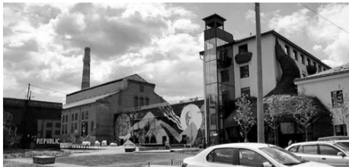
Рис. 3. Завод “Галичскло” після 2018 р.