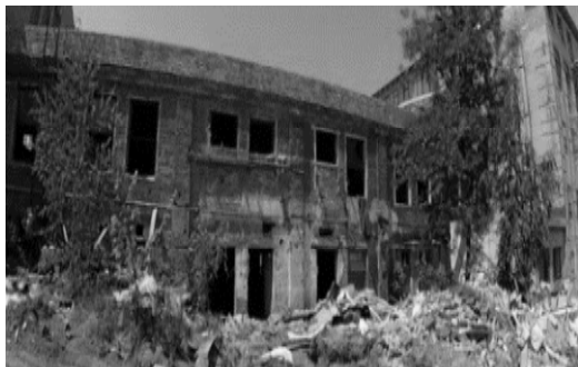
Рис. 2. Завод “Галичскло” до 2014 р.

Використання підходів до різних територій допоможе місту розвиватися та покращувати свій імідж. Сьогодні на частині цих підприємств розпочато процес ревіталізації. У 2015 році територію заводу “Галичскло”, площею 2 га, придбала мережа “!FEST” та реалізувала на цьому місці проект ревіталізації !FESTrepublic (рис. 2, 3). Головна ціль цього проекту – це підвищення атрактивності території міста, щоб туристи та львів’яни могли цікаво проводити час за межами площі Ринок. Новий культурний простір розташований за 3 км від центральної частини Львова. !FESTrepublic – це креативний простір, який забезпечує комфортне середовище для праці та відпочинку працівників компанії та відвідувачів. В основу !FESTrepublic закладено концепцію “містечка”, де кожен працівник має власну адресу з номером будинку та вулиці. Крім офісних приміщень, на території об’єкту передбачено влаштування концертного залу, їдальні, виробничих майстерень, складів, а також пекарні. Частина проекту реалізовано і вона вже функціонує, а на іншій досі проводять ремонтні роботи.