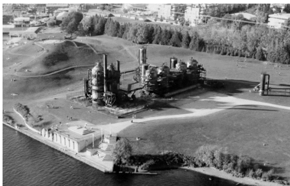
Рис. 1. Парк відпочинку на базі вугільно-газового заводу у Сієтлі, архітектор Річард Хааг.

5. Знесення – демонтаж застарілих, нерентабельних промислових об'єктів з метою побудови нових, сучасних об'єктів.