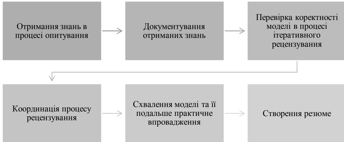
Рис. 2. Процес моделювання SADT [14]

На першому етапі процесу моделювання відомості про досліджувану систему отримують за допомогою випробуваної методики збирання інформації – опитувань чи інтерв'ю. Для одержання якнайповнішої інформації SADT пропонує доцільно різні її джерела (наприклад, робочі документи, контракти, опитування, спостереження за роботою системи).