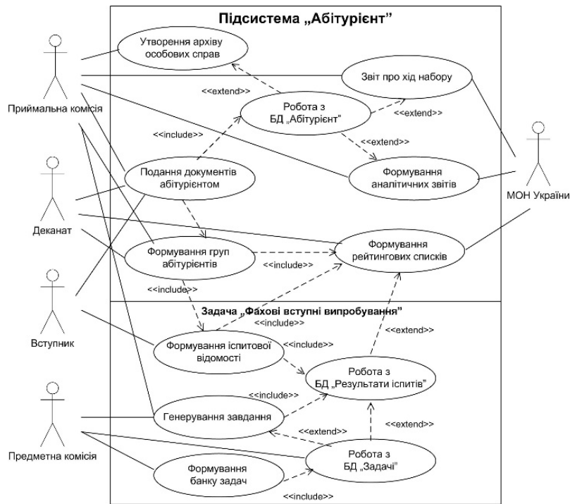
Рис. 2. Діаграма варіантів використання підсистеми “Абітурієнт”

Співробітники бюро розробляли підсистему “Розклад занять”, що мала об’єднувати підсистеми всіх видів навчально-методичної роботи. Основними джерелами інформації для постановки та розв’язання багатоаспектної задачі формування розкладу є організаційно-методична діяльність учбової частини (групи планування і управління учбовим процесом), ректорату, деканатів (інститутів) і кафедр ЗВО. Це дає змогу забезпечити інформаційну сумісність задачі з іншими пов’язаними з нею задачами управління за джерелами та споживачами інформації.