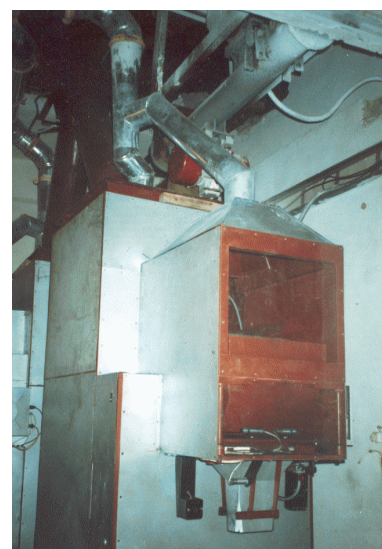
Рис. 2. Фасувальний напівавтомат (вигляд спереду)

• конструктивно технологічні параметри дозатора (вибрана конструктивна схема, величина дози, вибір