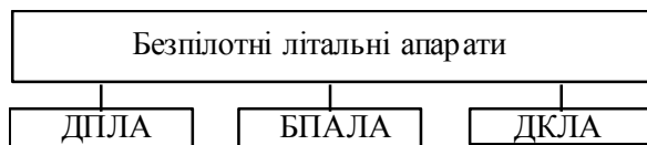
Рис. 2. Класифікація БПЛА за способами керування

Розрізняють дистанційно пілотований літальний апарат (ДПЛА) – безпілотний літальний апарат з управлінням, яке здійснюється із пункту управління, безпілотний автоматичний літальний апарат (БПАЛА) – безпілотний літальний апарат, що реалізовує своє функціональне призначення в автоматичному режимі відповідно до закладених у нього алгоритмів і програм функціонування та дистанційно керовані літальні апарати (ДКЛА). ДКЛА – безпілотні літальні апарати, що реалізують своє функціональне призначення переважно автономно, з епізодичним втручанням оператора управління для перепрограмування системи управління літальним апаратом. На рис. 2 подано класифікацію БПЛА за способами керування.