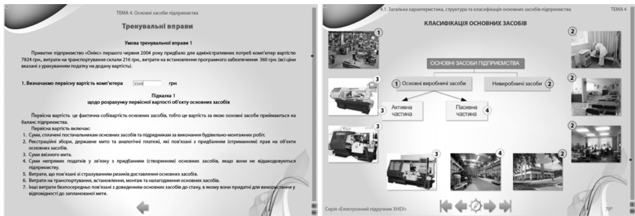
Рис. 4. Сторінка інтерактивної тренувальної вправи за темою, сторінка варіанта теми в схемах, що анімовані, із звуковим поясненням