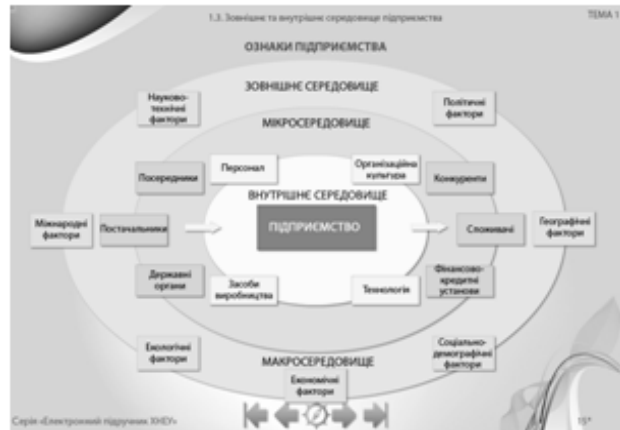
Рис. 2. Головна сторінка теми, сторінки теми за першою та другою методикою викладання