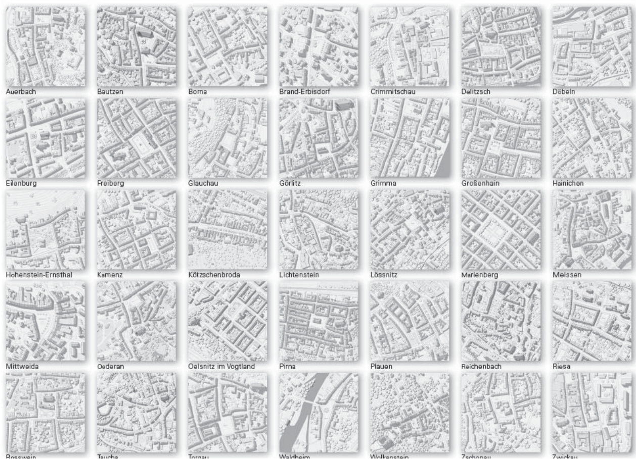
Рис. 2. «Атлас міст Саксонії» – генплани міст із зображенням дахів (фрагмент)

Продовженням проектної дискусії стала тема проекту літнього семестру 2016 р. – проблема розвитку центральної частини міста Франкенберг. На основі просторової моделі у масштабі 1:1000 студенти розробляли ідеї щодо того, як повинні формуватися керовані структури використання наявного житлового і громадського фонду для життя мешканців сучасного міста. Важливою проблемою, розглянутою у цьому проекті, стало вивчення того, як сучасні цифрові технології змінюють підходи до роздрібно́ї торгівлі та як це може вплинути на зміну форм міського середовища. Виконані дипломні роботи на цю тему окремо відзначено спеціальними нагородами.