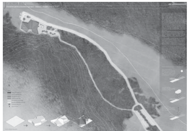
Рис. 3. «Печера Рай (PARADISE CAVE) – виставковий та дослідницький центр у місті Хенцини». Хенцини, Польща. Автор: Міколай Вєчорек. Кельце, 2017.

Максимально збільшити потенціал навколишнього середовища та об'єднати архітектуру з ландшафтом – основне завдання проектів.