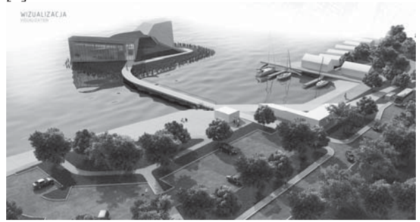
Рис. 2. «Озеро Бродське – туристична та відпочинкова зона». Броди, Свєнтокшиське, Польща, Автор: Кароліна Карбовнічек. Кельце, 2017. Джерело: [5]