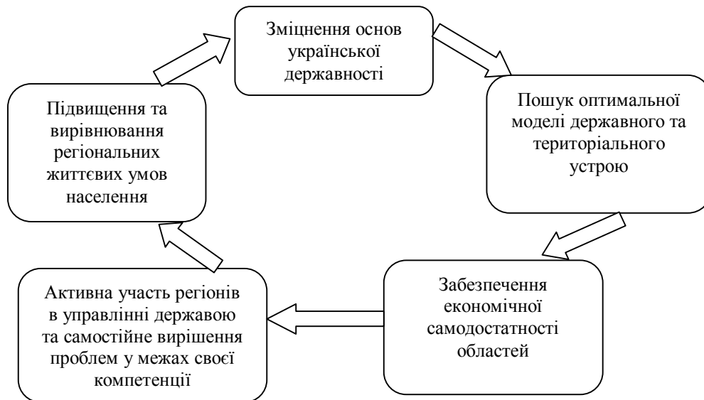
Рис. 4. Комплекс цілей регіональної політики

Комплекс цілей державної регіональної політики зображено на рис. 4 [7]. Державна регіональна політика спрямована на підвищення економічного зростання регіонів, покращення рівня життя людей, підтримку менш розвинутих територій країни.