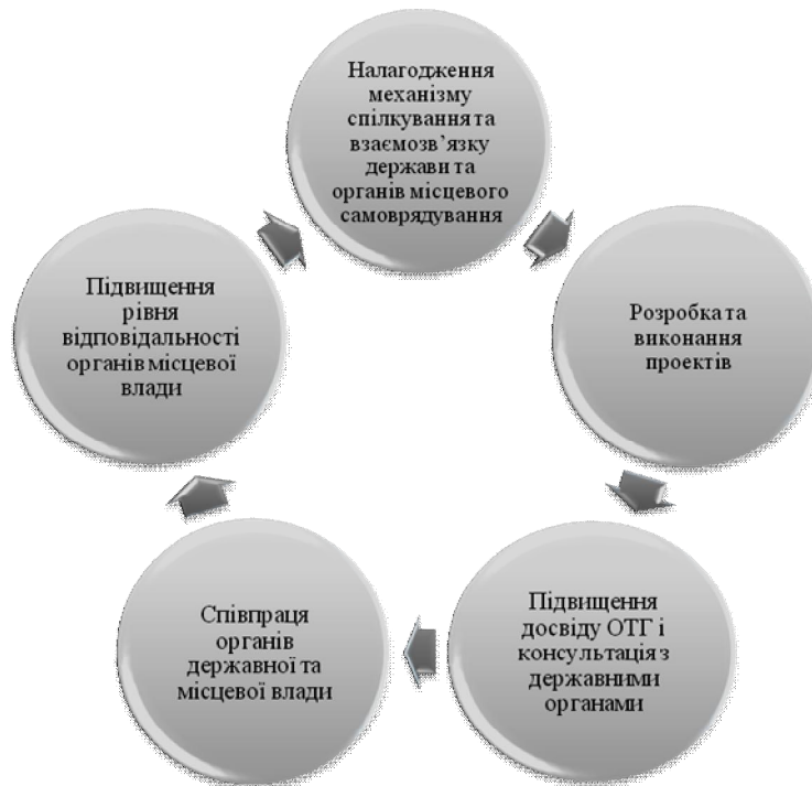
Рис. 2. Цикл співпраці держави та органів місцевого самоврядування

Варто також зазначити те, що ставлення до запровадження реформи децентралізації та створення об'єднаних територіальних громад таки має позитивну тенденцію і, на щастя, більшість опитаних все ж підтримує реформу за даними моніторингу сприйняття прогресу реформ, проведеного “Kantar TNS” для Національної ради реформ. Так, згідно з даними березня 2017 року, більша частина опитаних громадян (55 %) підтримує впровадження децентралізації, 15 % – не підтримують. Більше того, зменшилась ще й частка тих, хто повністю підтримує децентралізацію, на цілих 18 % порівняно з минулим роком. Регіональний розподіл прихильників децентралізації загалом свідчить про те, що досвід утворення об'єднаних територіальних громад (ОТГ) позитивно впливає й на сприйняття реформи загалом. Все більше і більше громадян України починають