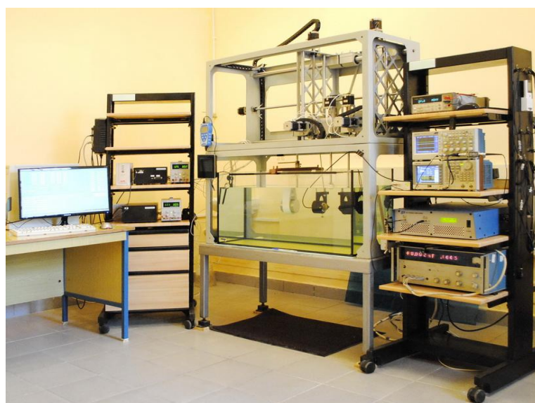
Рис. 3. Державний первинний еталон одиниці ультразвукового тиску у водному середовищі