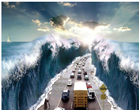
Рис. 3. Вхідне зображення