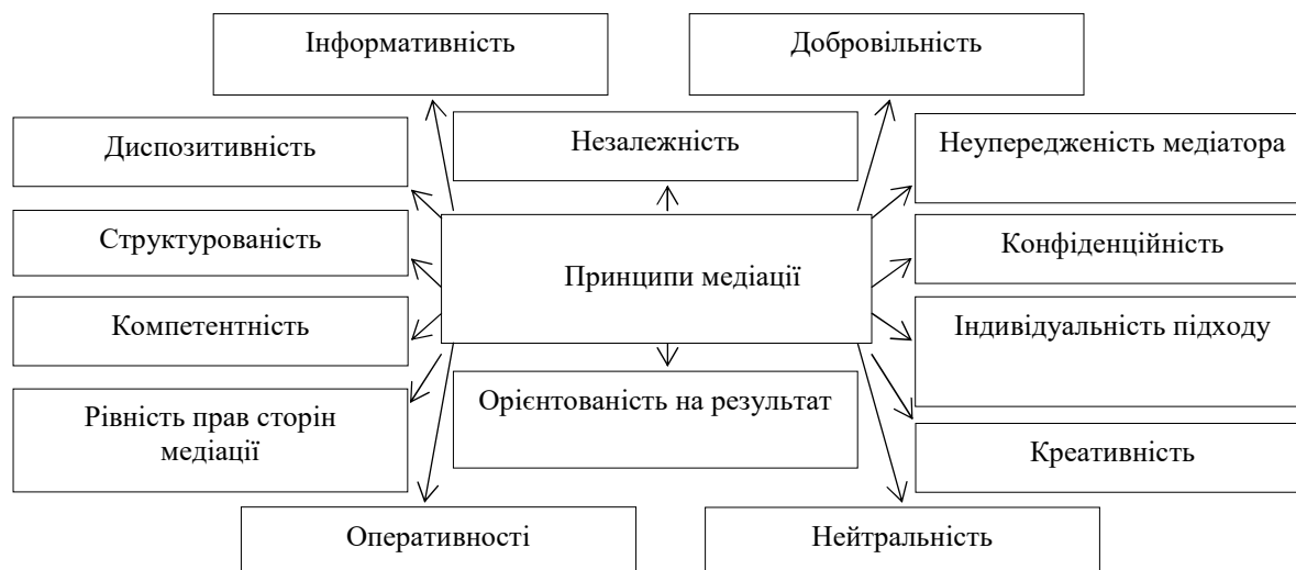
Рис. 1. Принципи медіації

проведення процедури медіації; за середовищем функціонування; за способом взаємодії процедури медіації із судовим провадженням; за ступенем обов'язковості; за критерієм платності послуг медіатора; за суб'єктом, який ініціює процес медіації; за кількістю медіаторів; за технологією проведення медіації; за зв'язком медіатора зі сторонами контракту; за характером проведення; за сферами застосування.