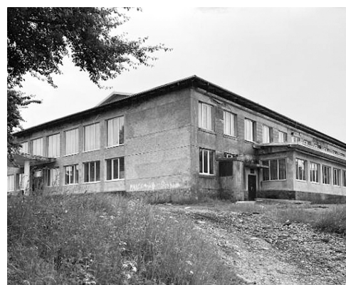
Рис. 9. Будинок культури села Добростани Львівської області