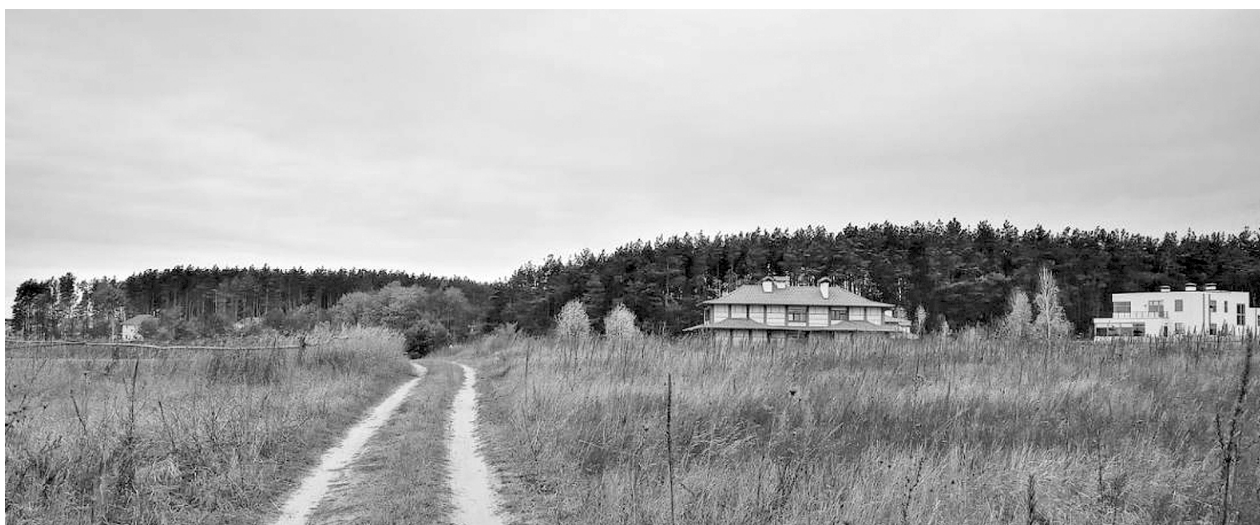
Рис. 5. Житлова забудова в селі Колонщина Київської області

Двоповерхові розміздки будівлі клубів, будинків просвіти невдало вписуються в сільські ландшафти. Експлуатація та обслуговування пострадянської забудови також створює багато проблем для селян (рис. 9).