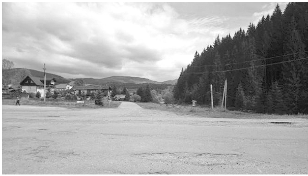
Рис. 3. Головна вулиця села Вишків Івано-Франківська область

Питання вирішення забудови та розпланування сучасного села може вирішуватись з врахуванням детального аналізу, існуючого стану території. Всі складові населених пунктів, починаючи від стану вулиць та існуючих інженерних мереж до забудови, що вже існує є невід'ємними ланками. Якщо висвітлювати питання вуличної мережі, то якісний стан не відповідає сучасним вимогам експлуатації сучасної техніки (рис. 3, 4). Недоліки є як у самій якості вуличного покриття, так і в особливостях розпланування, це стосується ненормованих профілів вулиць, невдалих розв'язок вузлових елементів (як композиційно, так і технічно).