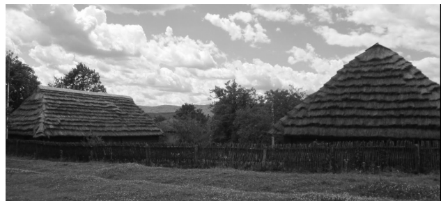
Рис. 2. Житлова забудова села Нагуєвичі Львівської області