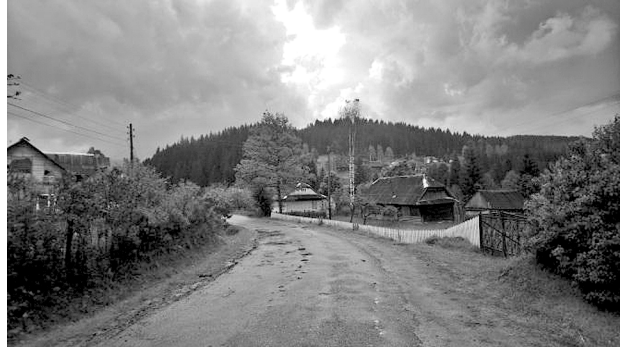
Рис. 4. Житлова вулиця села Вишків Івано-Франківська область