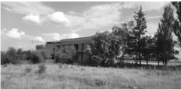
Рис. 1. Залишки адміністративного будинку виробничої зони у селі Чорноземне Запорізької області

На цьому етапі науковці поняття “сільські території” тлумачать як складну багатофункціональну природну, соціально-економічну й виробничо-господарську систему з властивими їй кількісними, структурними, природними й іншими характеристиками. Збереження традицій сільських місцевостей, продиктованих кліматом, ландшафтом, та іншими подіями дають можливість розвивати туристичну інфраструктуру, що дасть вагомий внесок в розвиток країни (рис. 2). Відповідно, така система вимагає далеко не типового підходу у вирішенні розпланування території та забудови. Існування пострадянського спадку в більшості випадків у селах України зазнало суттєвої реновації. На це впливають сучасні економічні та соціальні процеси у суспільстві.