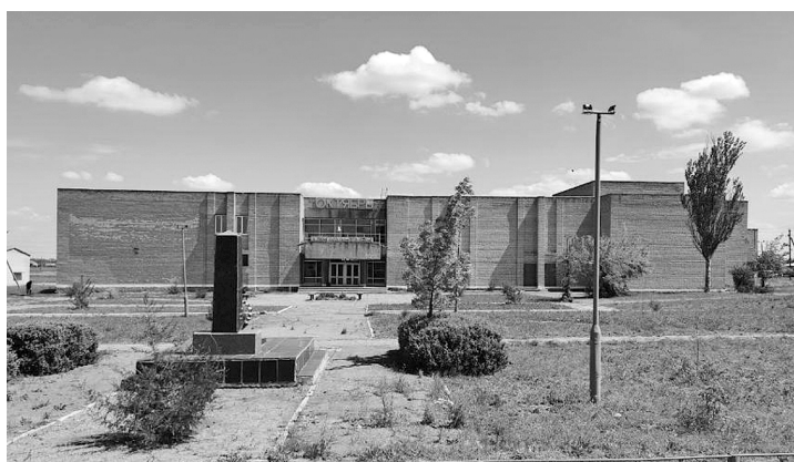
Рис. 8. Будинок культури в селі Черноземне Запорізької області