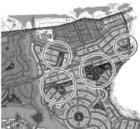
Рис. 3. Формування забудови приміських агрорекреаційних поселень шляхом утворення об'єднаних комунікаційних просторів

– Агрорекреаційні села, що розвиваються в приміських зонах великих міст, стають ареною забудов рекреаційних котеджних масивів або включення в межі садово-дачних товариств. Основні прийоми розміщення таких масивів наступні. Екстраполяція (розвиток з поширенням) планувальної структури забудови села в бік основної ландшафтної принади – ріки або лісу. Це відбувається за рахунок освоєння новою забудовою територій, прилеглих до існуючого села з виходом на прибережні (прирічкові) території. Можливість цього забезпечується за рахунок високої вартості приміської землі та відповідно – об'єктів будівництва, яка дозволяє здійснювати інженерне облаштування цих територій, що були раніше непридатними для житлової забудови через можливість затоплення, підтоплення або ж через високий рівень ґрунтових вод. Таким чином, формуються значні масиви рекреаційної дачної та котеджної забудови, що суттєво змінює соціально-економічну ситуацію в конкретному поселенні (рис. 3).