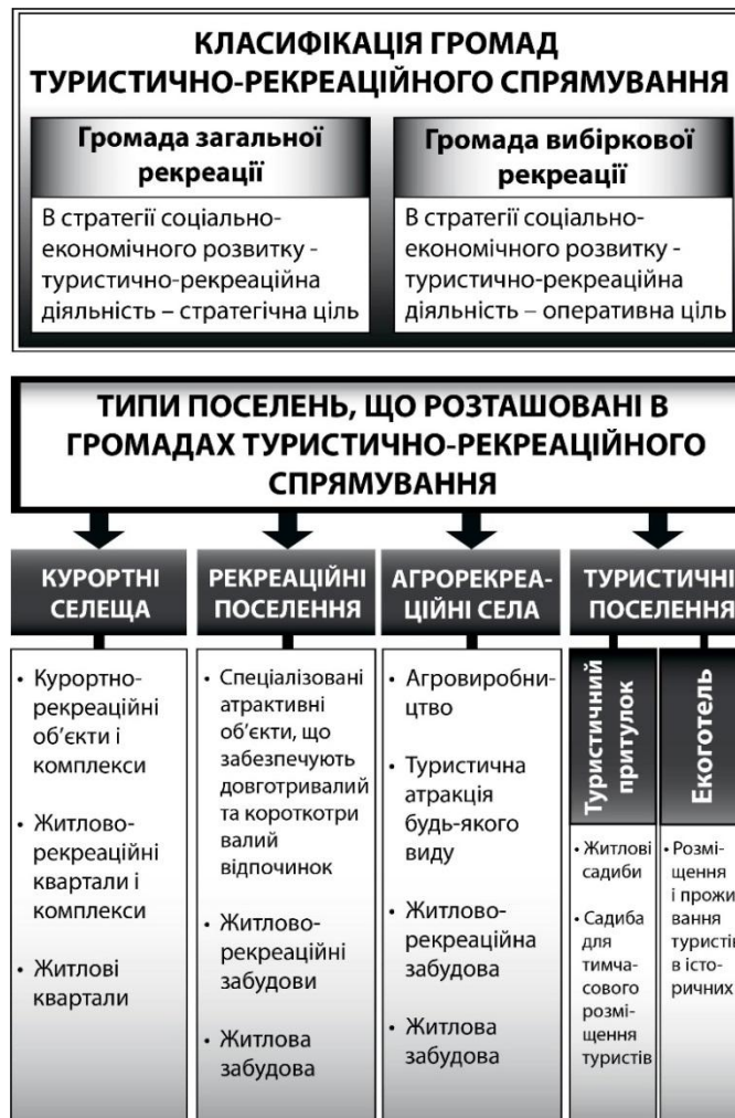
Рис. 1. Класифікація громад та види поселень туристично-рекреаційного спрямування

– Прийоми архітектурно-планувальної організації сільських поселень, що складають відповідні об'єднані територіальні громади, класифікуються у відповідності до типів поселень з агрорекреаційними функціями, базуючись на застосуванні принципу неперервності та органічного поєднання планувальних структур курортно-рекреаційних об'єктів та комплексів, житлово-рекреаційних об'єктів з одного боку, та інших структурних елементів населених пунктів – з іншого.