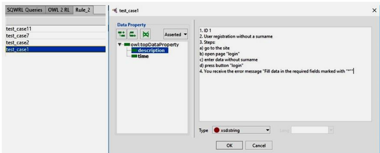
Рис. 2. Результат виконання програмної системи

У базі знань містяться тесткейси, які вже були протестовані і які не є ще протестовані. В результаті виконання цього правила виведено ті тесткейси, які не є протестованими (рис. 2).