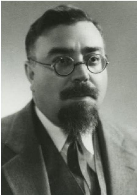
Рис. 1. Норберт Вінер (26 листопада 1894 р. – 18 березня 1964 р.)

Після захисту Н. Вінером докторської дисертації Гарвардський університет надав йому стипендію для подорожі за кордон. Він використав її, щоб побувати у двох відомих наукових центрах: в Англії – у Кембриджі (University of Cambridge), у Німеччині – у Геттінгені (University of Göttingen). У Кембриджі головним учителем і наставником Н. Вінера був Бертран Рассел (Bertrand Russell), під керівництвом якого він вивчав математичну логіку. Вінер також відвідував лекції з вищої математики, які читав видатний англійський математик Г. Х. Харді (Godfrey Harold Hardy). За його словами, вони приносили йому “справжню насолоду”. У Геттінгені вчителями Вінера стали видатні математики Едмунд Ландау (Edmund Landau) та Давид Гільберт (David Hilbert). Надалі Н. Вінер поглиблював свої знання у Колумбійському університеті, потім знову у Гарвардському університеті як викладач-стажист, і в університеті штату Мен.