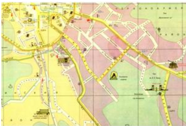
Рис. 4. Фрагмент туристської схеми "Львов", 1974 р.

Подібним до попередніх видань схем міста було навантаження тематичного змісту. Відповідно до духу часу з'явилися рубрики об'єктів "Пам'ятники та пам'ятні місця історико-революційних подій", "Пам'ятники та місця, пов'язані з подіями Великої вітчизняної війни". У переліку архітектурних пам'яток на відміну від попередніх видань почали упускати назви церков і костелів, зазначаючи лише, що це архітектурні пам'ятки.