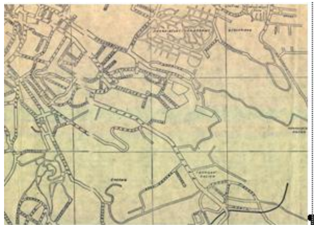
Рис. 1. Фрагмент “Схематичного плану міста Львова”, 1947 р.

Для широкого загалу населення призначено “Схематичний план міста Львова”, який у 1947 р. видало Добровільне пожежне товариство накладом 15 000 примірників (рис. 1). Одноколірний план (реклама – у дві фарби) створено у Львівському облпроекті: уклав Л. Трифон під редакцією В. Новікова та П. Міщенко. План розміром 50,5 × 67,5 см практично відображає всі вулиці та площі міста, містить їх нові назви, що є головним достоїнством цього видання. Хоча з картографічного боку це був доволі простий план. Перелік вулиць та площ міста подано на зворотній стороні плану.