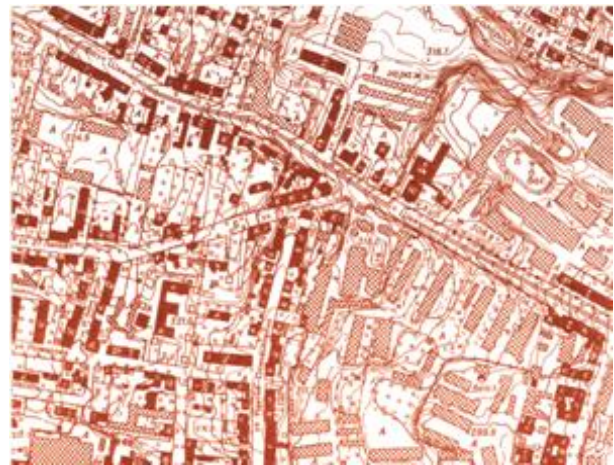
Рис. 2. Фрагмент топографічного плану міста масштабу 1: 5 000, 1980 р.

Підготовку топографічних планів до видання здійснив у 1980 р. цех № 2 Підприємства № 13. Загалом підготовлено до видання 101 трапецію (73 повних і 28 неповних) площею 87,25 км 2 масштабу 1:2 000 і 50 трапецій (45 повних і 5 неповних) площею 75,75 км 2 масштабу 1:5 000. З видавничих оригіналів топографічних планів Львова масштабів 1:2 000 і 1:5 000 виготовлено одноколірні відбитки по 30 примірників, з яких 3 на кальці. Топографічні плани мали обмежувальний гриф “тасмно” (рис. 2).