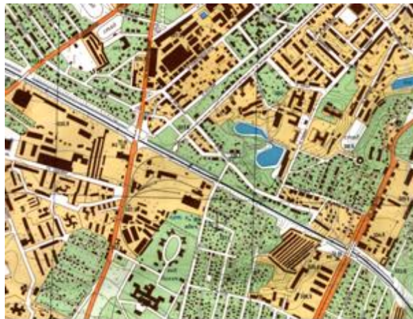
Рис. 3. Фрагмент топографічного плану міста масштабу 1: 10 000, 1987 р.

продукції навіть з доволі схематичним зображенням внутрішньоміської ситуації.