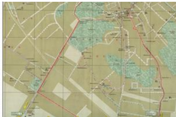
Рис. 6. Фрагмент схеми пассажирського транспорту “Львов”, 1984 р.

На основі туристичної схеми міста, виданої у 1982 р., укладено та підготовлено до видання план “Львов. Схема пассажирского транспорта”, яка двічі виходила у світ у 1984 і 1986 рр. (рис. 6). Видання містить врізку “Схема приміських маршрутів автобусного та залізничного транспорту”.