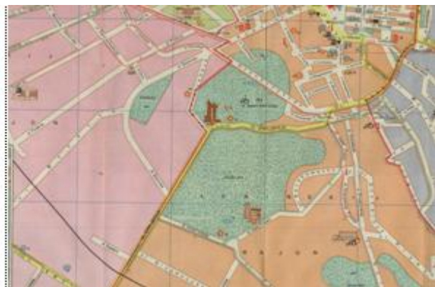
Рис. 5. Фрагмент туристської схеми "Lwow", 1979 р.

На основі російськомовного плану міста "Львов. Туристская схема" у 1979 р. видано практично ідентичні схеми міста англійською, німецькою та французькою мовами (редактор Ю. І. Лоза). Назви вулиць, площ, парків транслітеровані латинкою і були однаковими на всіх планах, виданих іноземною мовою (рис. 5).