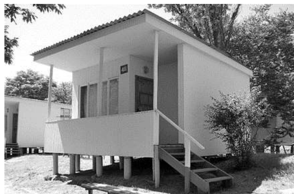
Рис. 5. База відпочинку "Академічний" у Чорноморську