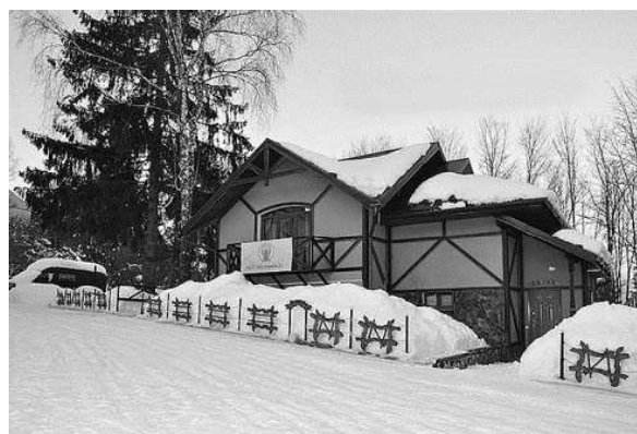
Рис. 4. База відпочинку "Політехнік-2" у Славську