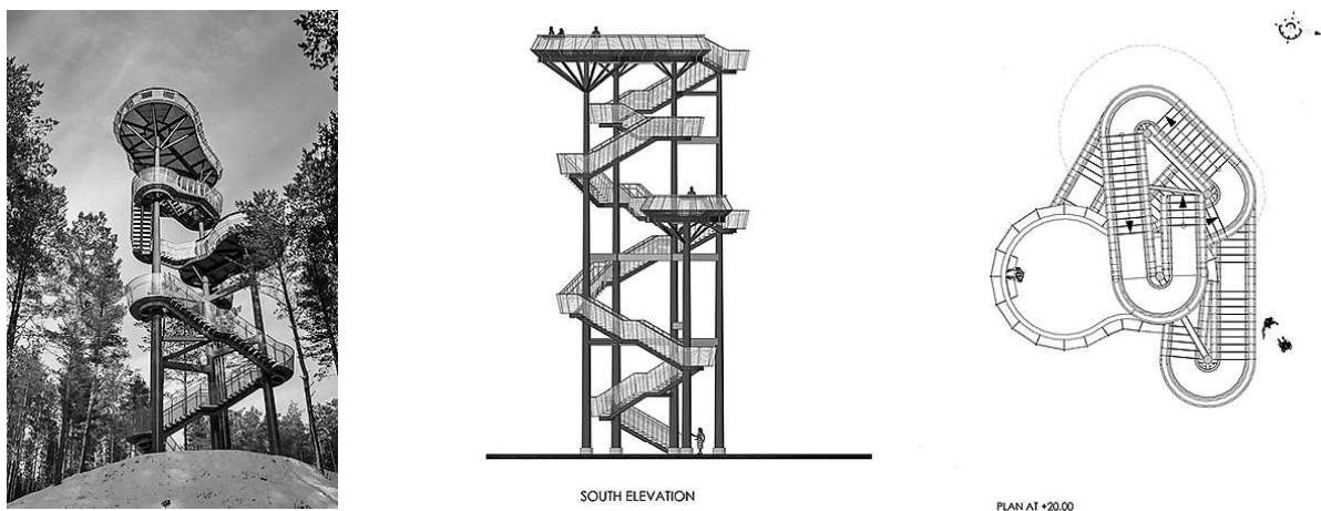
Рис. 3. Оглядова вежа в Литві

На відміну від закордонних аналогів, більшість українських відпочинкових баз, які перебувають на державному фінансуванні, вирізняються простотою архітектури та дизайну, проте пропонують широкий асортимент послуг. База відпочинку "Політехнік-2" у Славську (рис. 4), яка належить Національному університету "Львівська політехніка", розміщена в гірській місцевості, тому пропонує різноманітні види активного відпочинку в горах. Взимку – це катання на лижах та сноубордах, для чого передбачені траси різної складності. Для функціонування у інші пори року на території бази розміщено стадіон, спортивний майданчик для волейболу, баскетболу, мініфутболу, є можливість пограти у настільний теніс та більярд, відвідати сауну, скористатись платними екскурсіями гірськими схилами. База складається із 4 корпусів, кожний із яких містить основний перелік приміщень: готельні номери, санітарні та технічні приміщення, зони для відпочинку.