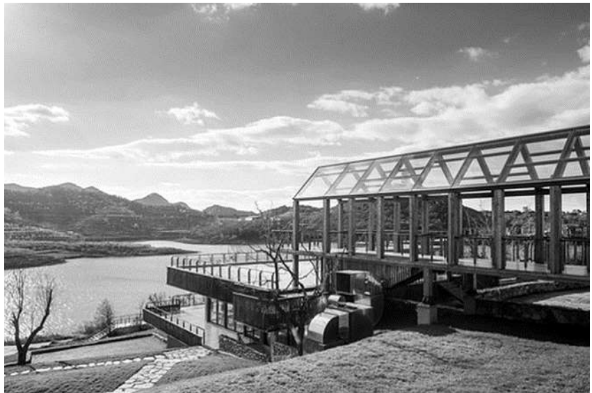
Рис. 1. Міжнародний курорт у Пекіні